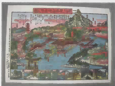
日本三景ノ一 厳島実地真景之図 明治30年(1897)